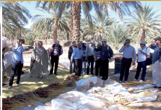
Voyage d'étude - Tunisie