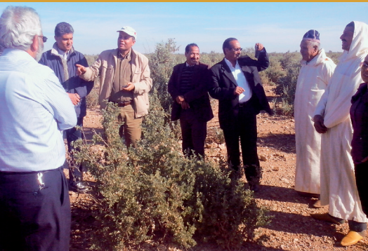
Voyage d'étude - Maroc